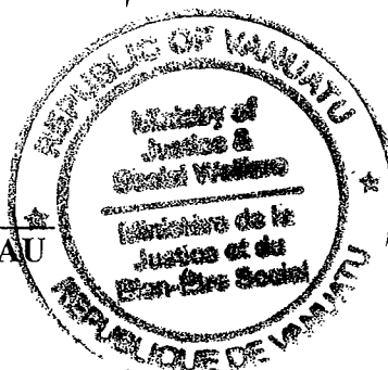
Honourable JOSHUA TAFURA KALSAKAU Minister for Justice and Social Welfare

Made at Port Vila this 19 th day of July 2007.